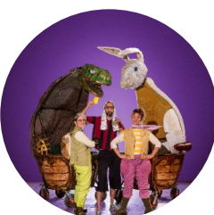
La llebre i la tortuga