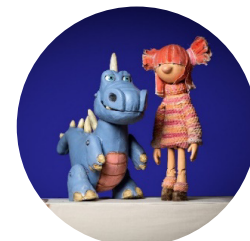
Maure el dinosaure