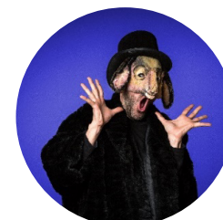
La Senyora de Tous