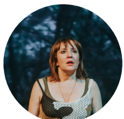
La dona del tercer segona