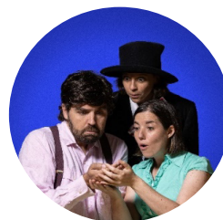
En Patufet (i els seus pares)