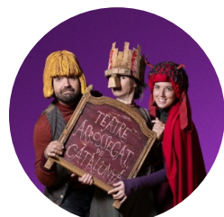
Teatre Arrossegat de Catalunya