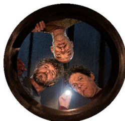
Els ossos de l'irlandès