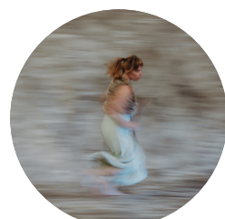
L'ombra de l'alzina