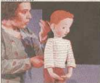
Una escena de l'obra de Teatre Nu

nuts en el transcurs dels quals era agradable observar com els nens i les nenes que omplien les butaques de l'Ateneu quedaven captivats pel que passava a escena. I és que si hi ha un aspecte que caracteritza aquesta companyia és exactament aquest: el fet d'aconseguir que els infants que assisteixen als seus espectacles els veguin i els segueixin.